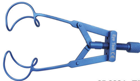
SP-8034 田邊氏テンポラルビュー開瞼器 14mm ¥49,800

田邊氏テンポラルビュー開瞼器は、耳側術野の確保を目的として開発されました。耳側操作が主となる手術においては、広く安定した手術稼働域を提供するテンポラルビュー開瞼器が有効です。例として、耳側切開の白内障手術や緑内障手術(内から)、耳側強膜弁の作製を伴う緑内障手術(外から)、耳側インフュージョンポートの設置を伴う硝子体手術等で、特に力を発揮します。