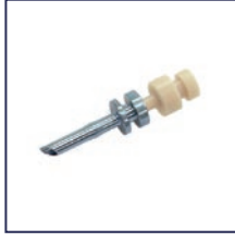
PAT. P. 2006-152946 8-640-2 ステップカニューラ 23G ¥ 9,800