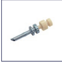
8-640 内藤氏ステップカニューラ 25G ¥ 9,800