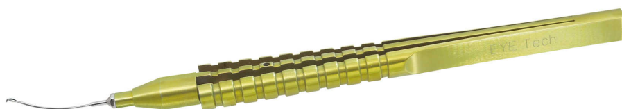
FR-2287S 今井氏カプスロレキシス鑷子 27G 強化シャフト